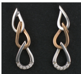
E357 Timantit: yht. 0,05 ct, W/SI