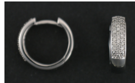
E379 Timantit: yht. 0,25 ct, W/SI