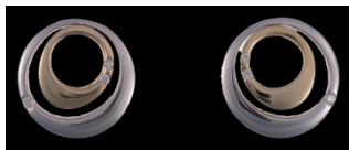
E366 Timantit: yht. 0,06 ct, W/SI