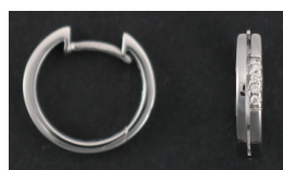
E368 Timantit: yht. 0,04 ct W/SI