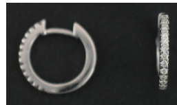
E378 Timantit: yht. 0,25 ct, W/SI