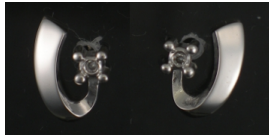
E345 Timantit: yht. 0,01 ct, sc