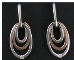
E365 Timantit: yht. 0,03 ct, W/SI