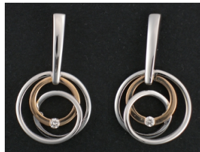
E358 Timantit: yht. 0,05 ct, W/SI