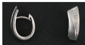
E313 Timantit: yht. 0,01 ct, W/SI, sc