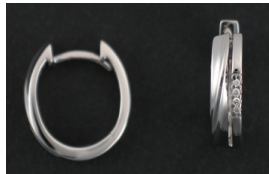
E377 Timantit: yht. 0,03 ct, W/SI