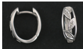
E349 Timantit: yht. 0,03 ct, sc